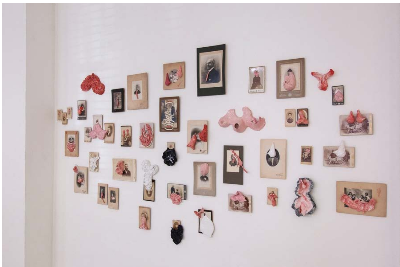
MARCELLA VANZO, THE BIG PICTURE - LUCIE FONTAINE, MILANO